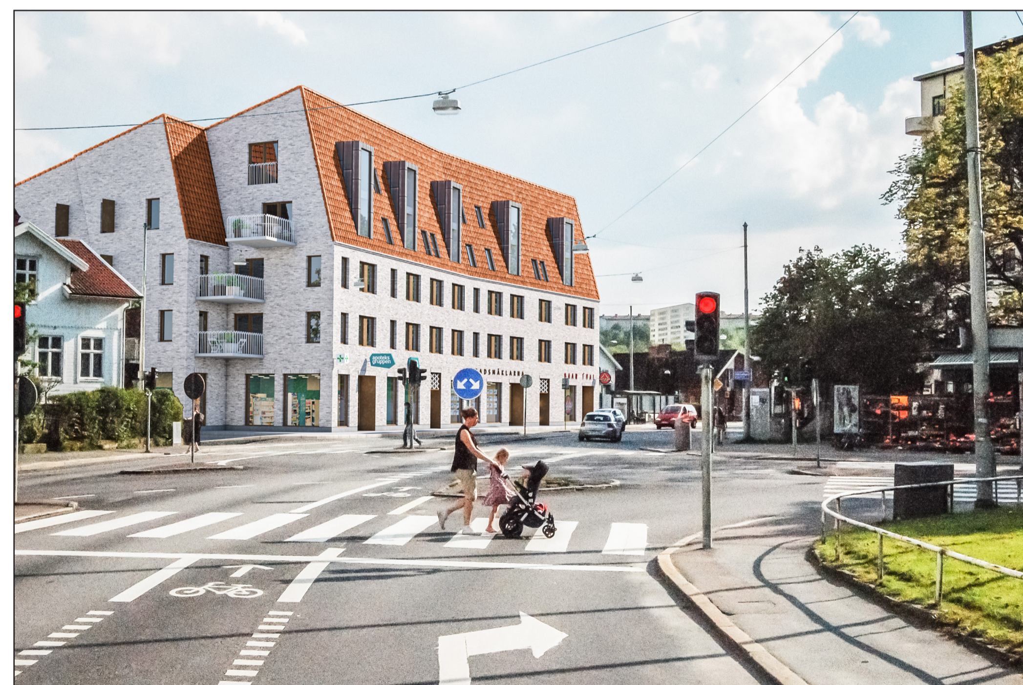
Förslag till utbyggnad av planområdet, en byggnadsvolym som följer gaturummet och som i sin skala, volym och material anknyter till både riksintresset på Övre Johanneberg och till villastaden i Krokslätt. Vy från nord-ost på Eklandagatan. (Okidoki arkitekter, 2016).