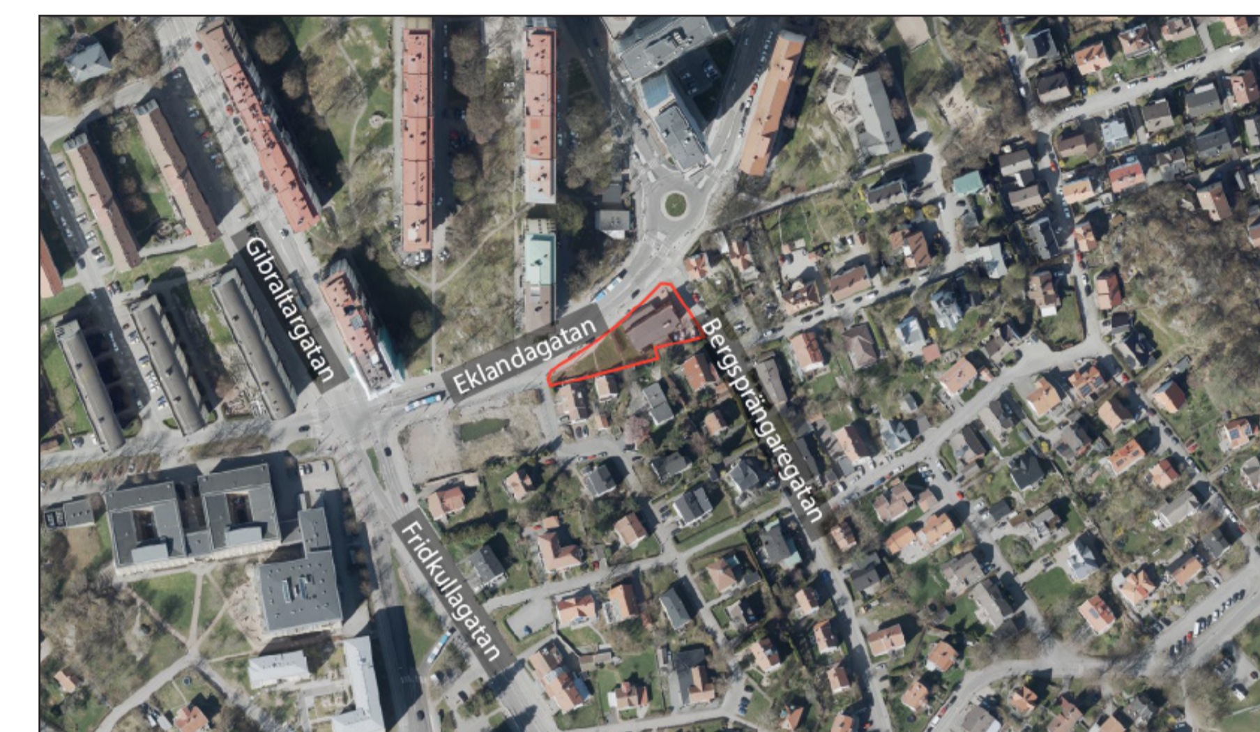
Översiktsbild med planområdets ungefärliga läge